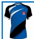
Nouveau maillot: 20€