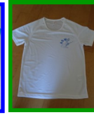
Tee shirts bleus adultes, ou blancs enfants: 10€